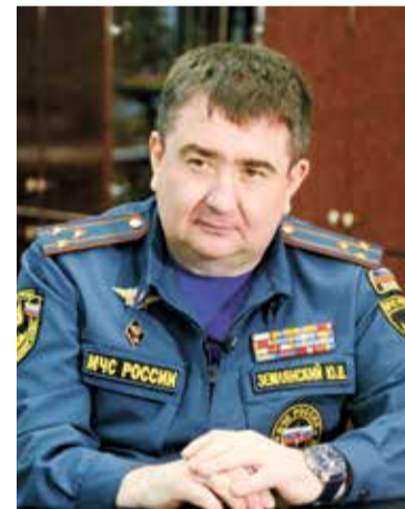
Юрий ЗЕМЛЯНСКИЙ, начальник ГУ МЧС России по Курганской области

Считаю, площадки салона «Комплексная безопасность» — это возможность для прямого диалога между представителями органов власти и индустрии безопасности. В целом ожидаю продуктивной работы, которая будет направлена на повышение эффективности выполнения мероприятий в области безопасности жизнедеятельности населения страны.