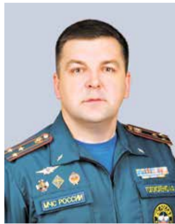
Александр ГОЛОКОЛЕНКО, начальник ГУ МЧС России по Карачаево-Черкесской Республике

Безусловно, основные ожидания от работы салона — не только налаживание деловых контактов с разработчиками систем защиты и средств безопасности, ознакомление с техническими инновациями, но и рассмотрение возможности применения научных и технических инноваций в повседневной и оперативной деятельности чрезвычайного ведомства на территории субъекта. Для руководителей территориальных органов МЧС России салон — это еще и деловое общение с коллегами в формате круглых столов, где происходит своеобразный обмен опытом профессиональной деятельности в реализации поставленных задач по обеспечению безопасности населения и вверенной территории.