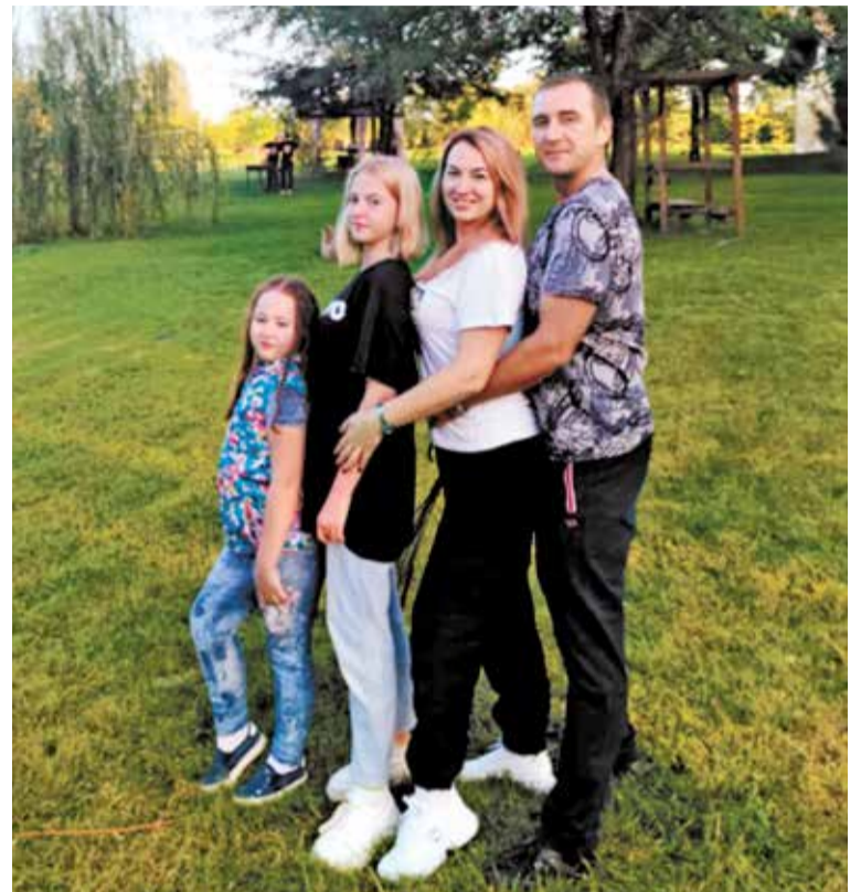
Семейство Кошевых: работа в МЧС повышает прочность семьи

Именно МЧС нас объединило и связало. Одно из направлений в ведомстве для поддержки молодых семей — распределение выпускников-супругов в один регион, как произошло в нашем случае в 2017 году. Благодаря этому мы не разлучались ни на день после выпуска из академии.