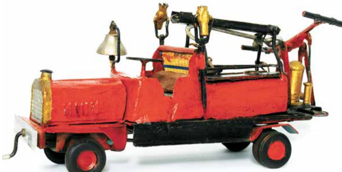
Модель пожарного автомобиля «Краснознаменец»

нические мастерские, где автомобили иностранных марок «Паккард», «Пирс-Эрроу», «Опель», «Дикси» и другие переоборудовались в пожарные. Машины были заново построены, капитально отремонтированы, специально приспособлены, оборудованы насосами, электрическими сигналами, светом и имели заводское качество. Была проведена работа по отбору однотипных моделей для переоборудования в пожарные, боевое ядро которых в Главной части составили автомобили марки «Паккард».