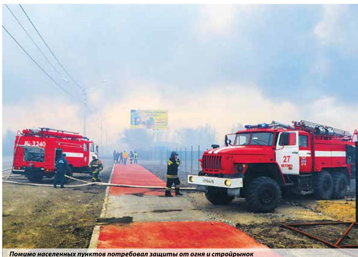
Помимо населенных пунктов потребовал защиты от огня и стройрынок

рынку со стройматериалами. Тушение, в котором были задействованы 111 человек и 45 единиц техники, осуществлялось по двум основным направлениям.