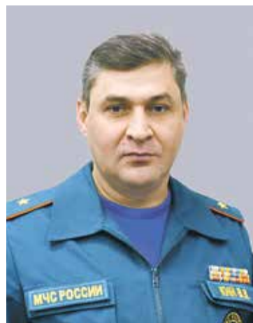
Владимир КИЙ, начальник ГУ МЧС России по Ставропольскому краю

Уверен, что множество круглых столов позволит установить новые контакты, объединить специалистов в области обеспечения безопасности различных сфер жизни и сформировать предложения по совершенствованию механизмов межведомственного взаимодействия между органами власти, службами и организациями.