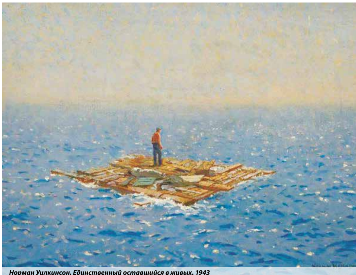
Норман Уилкинсон. Единственный оставшийся в живых. 1943

В качестве примера можно вспомнить судьбу советского сухогруза «Павлин Виноградов». Свое название он получил в честь погибшего в годы Гражданской войны командующего Северо-Двинской речной военной флотилии Павлина Федоровича Виноградова. Сухогруз совершал рейсы между советскими дальневосточными и американскими и канадскими тихоокеанскими портами и 22 апреля 1944 года в районе Алеутских островов был атакован японской подводной лодкой. Хотя СССР и Япония на тот момент придерживались взаимного