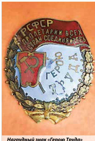
Нагрудный знак «Героя Труда»