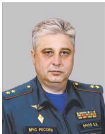
Виктор ОРЛОВ, начальник ГУ МЧС России по Новосибирской области

Безопасность является приоритетом государства. Прекрасным примером демонстрации результатов государственной политики и достижений в области обеспечения безопасности населения и территорий служит крупнейший российский выставочный проект международного уровня — салон «Комплексная безопасность».