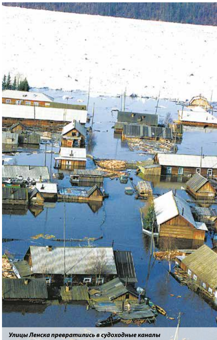
Улицы Ленска превратились в судоходные каналы

Жителей эвакуировали за город, в здание аэропорта и на расположенную севернее города гору Шаман, где спешно развернули палаточный лагерь. К эвакуационным пунктам подвозили питьевую воду, хлеб,