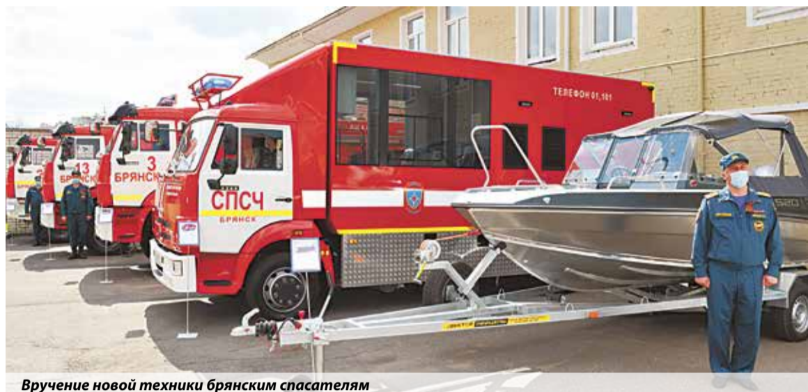
Вручение новой техники брянским спасателям

Автопарк региональных пожарно-спасательных гарнизонов претерпевает существенные изменения.