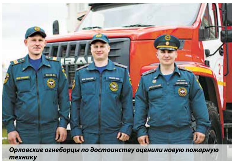
Орловские огнеборцы по достоинству оценили новую пожарную технику

Главным событием дня стало вручение новой пожарной и аварийно-спасательной техники, приобретенной за счет средств федерального бюджета. Руководителям подразделений брянского пожарно-спасательного гарнизона вручили ключи от двух пожарных автоцистерн, автомобиля базы газодымозащитной службы, пожарной насосной станции, моторной лодки «Мастер Про 520» и автомобиля УАЗ «Патриот Пикап». По сложив-