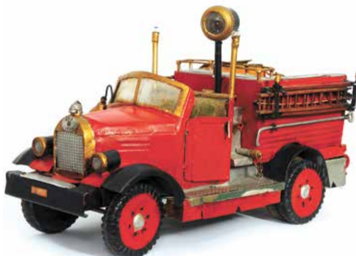
Модель пожарного автомобиля «Полундра»