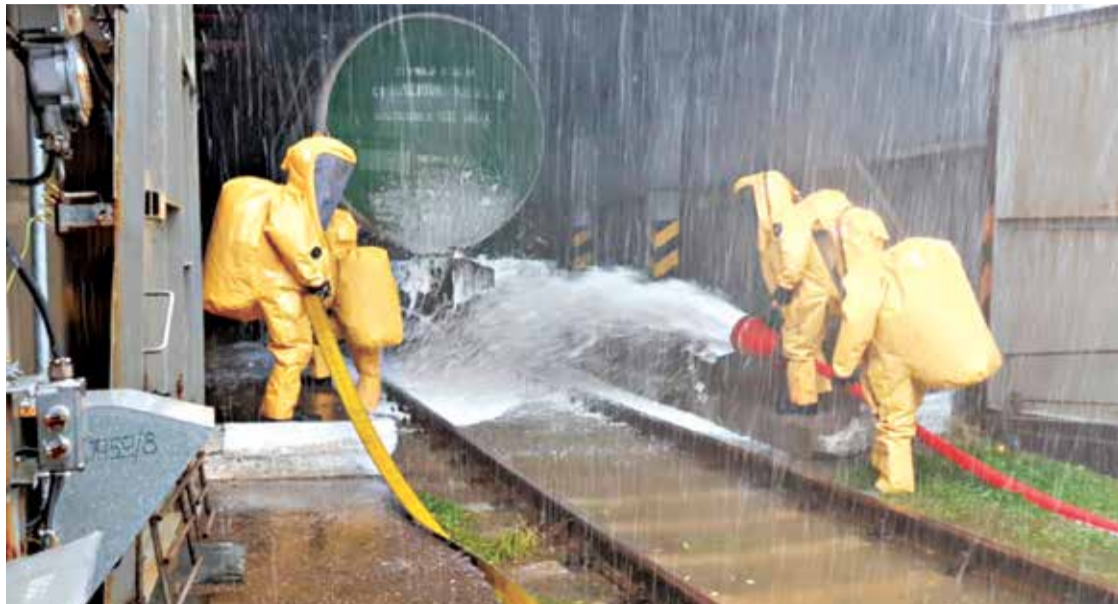
Зачастую именно МЧС России приходится разбираться с последствиями негативного воздействия на окружающую среду промышленных объектов

— Регулирование станет практически новой вехой в экологической истории страны. Мы должны поменять сознание, при котором можно было просто бросить свое предприятие с опасными отходами и возложить бремя ликвидации на плечи налогоплательщиков. Переходим к практическому применению принци-