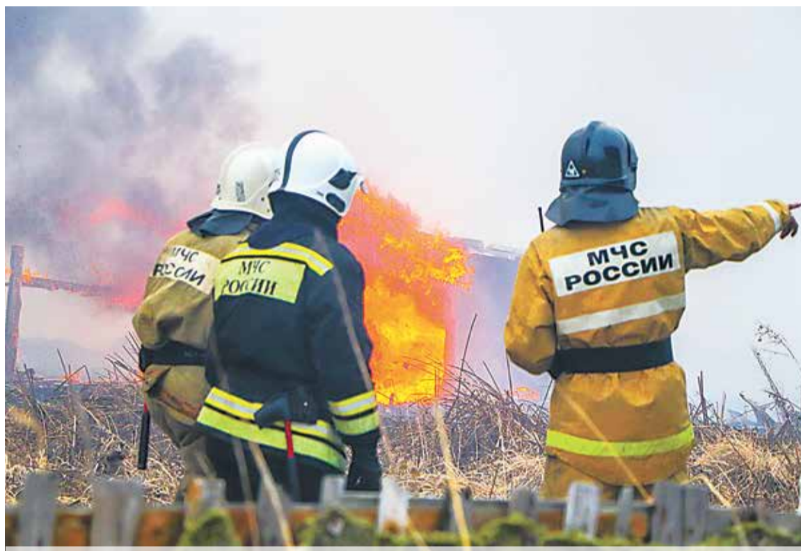
Майские праздники для курганских огнеборцев обернулись настоящим сражением с огнем

Ситуация была точно такой же, как и накануне: сухая жаркая погода, порывы ветра до 23 м/с. Пожар угрожал находящемуся рядом с очагами