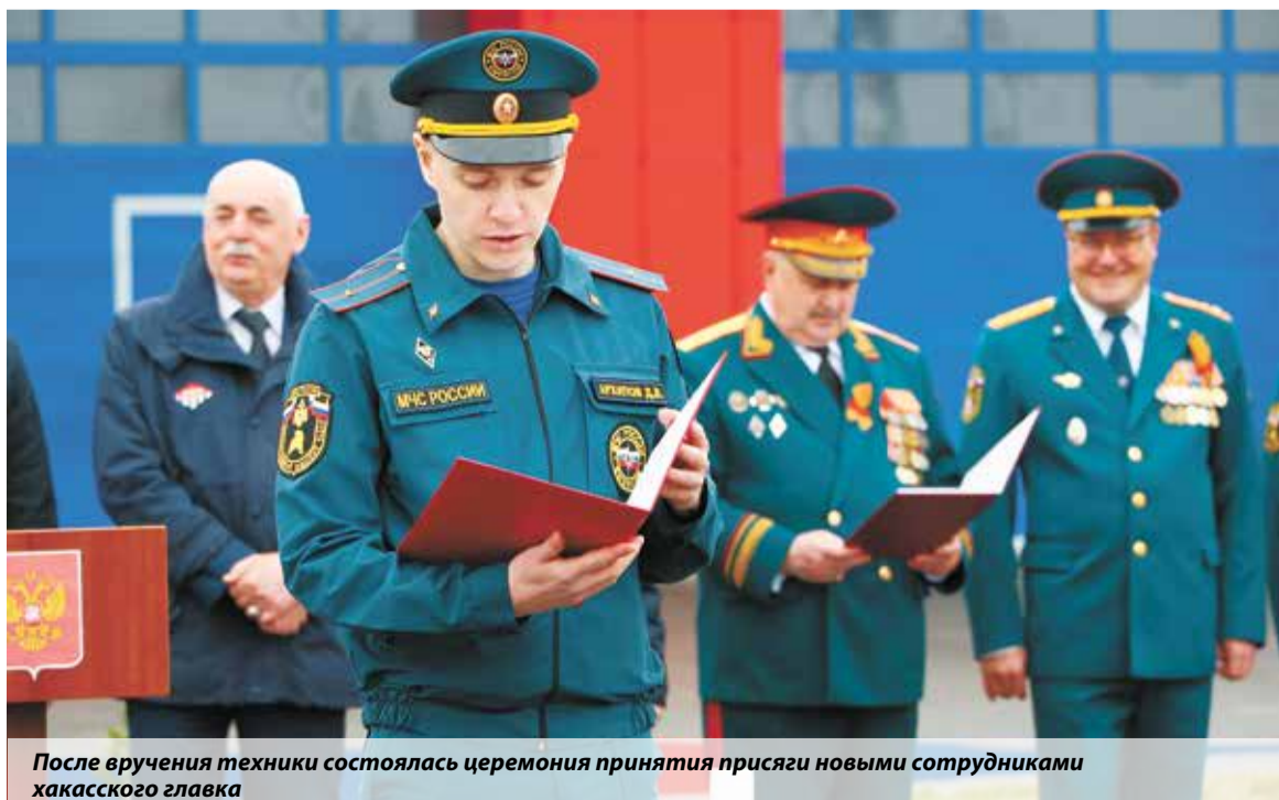
После вручения техники состоялась церемония принятия присяги новыми сотрудниками хакасского главка

Виктор Жестков, по материалам региональных пресс-служб